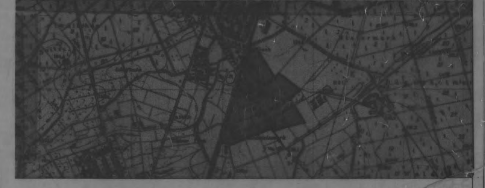
Übersichtsalageplan M. 1:25.000

Es wird bescheinigt, daß die Grenzen und Bemessungen der Flurstücke des Katasters des Liegenschaftskatasters entsprechen. Katasteramt Offenbach, am 17.09.1979 Im Auftrag P. 11